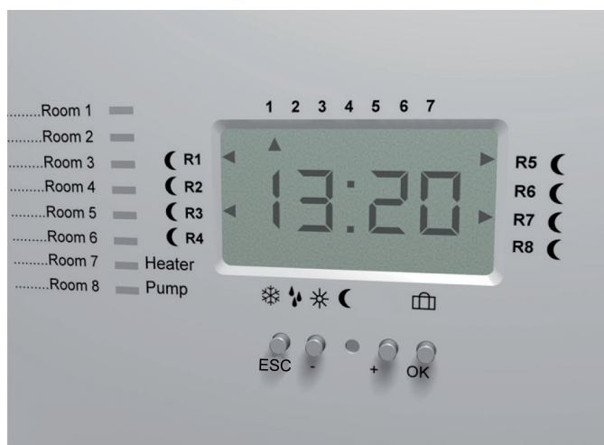
Cq 8 N - Utan ikon för Party-läge och ESC-knapp